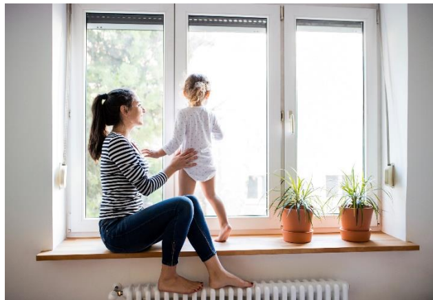
Figuur 1: ouder en kind kijken door het raam met een radiator onder de voeten.

Als u een verwarmingsketel installeert of vervangt, moet uw verwarmingssysteem voldoen aan eisen met betrekking tot de veiligheid, de energieprestaties en het respect voor het milieu. De naleving van deze eisen moet door een door Leefmilieu Brussel erkende deskundige worden nagegaan tijdens een controle die de EPB-oplevering wordt genoemd. De deskundige op wie u een beroep moet doen is een EPB-verwarmingsadviseur . Aan het eind van de controle zal deze persoon u een EPB-opleveringsattest overhandigen.